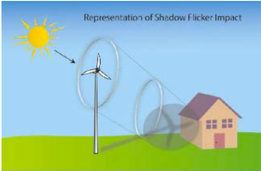
Şekil 2 Gölge Titreşimi Etkisi Örneği

İrlanda rüzgar çiftliği sahalarında genellikle gölge titreşimi sorunuyla karşılaşmamaktadır. Etkilenen sahalar bakımından ise gölge titreşim ihtimali, inşaat faaliyetleri başlatılmadan önce hesaplanabilir ve türbinler, yakındaki meskenler üzerinde etki en aza indirgenecek şekilde konumlandırılabilir.