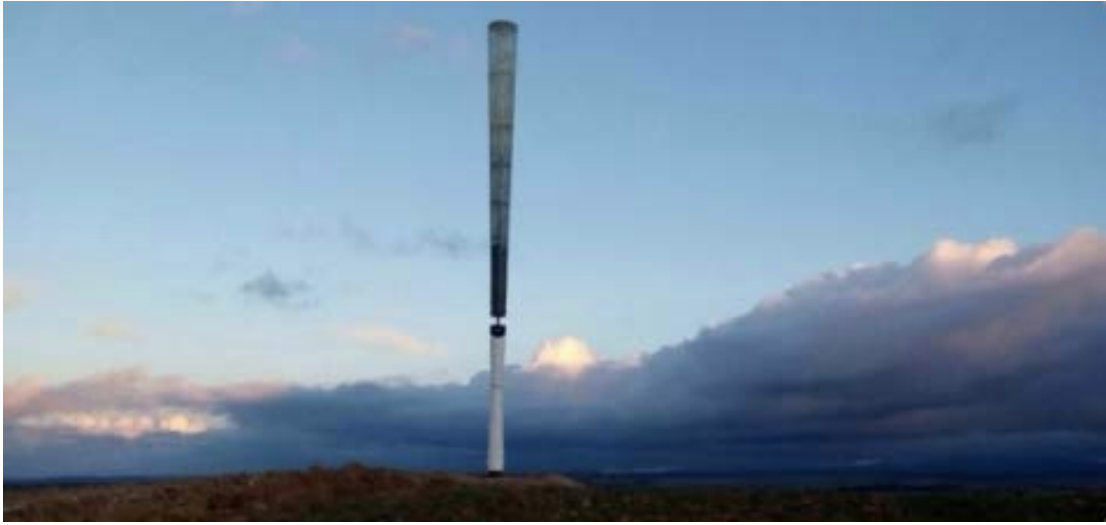
Şekil 4 Vortex Bladeless, kanatları olmayan rüzgar jeneratörü

Uçuş alanında dönüp duran üç kanatlı rüzgar türbinleri, iklim için iyi ancak kuşlar için öldürücüdür. Stratejik konumlandırma ve göçlerin yoğun olduğu dönemlerde devre dışı bırakmak yardımcı olabilir ancak bir İspanyol şirket, yakında piyasaya sürülecek daha iyi bir sonuç icat etmiş olabilir; Vortex Bladeless.