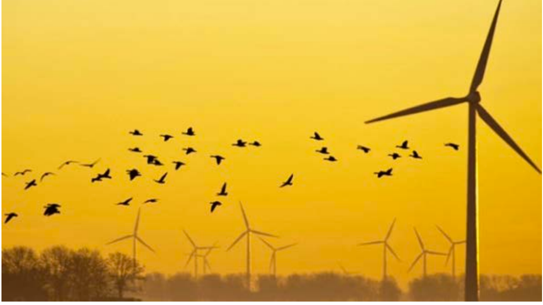
Şekil 3 Rüzgar çiftliği ve göç eden kuşlar

Kuş odaklı önlemler arasında reflektörler, görsel caydırıcılar ve lazerlerin kullanılması en etkili görsel işaretler olmuş ve her biri 2,50 veya daha fazla puan almıştır. Sıklıkla ayna biçimindeki reflektörler, güneş ışığı altında kuşların türbinden uzak durmasını sağlayabilecekken lazerler gibi aktif görsel uyarıcılar, az ışık seviyesi altında etkili olacaktır ve dolayısıyla daha çok gececi hayvanlar için uygun olacaktır.