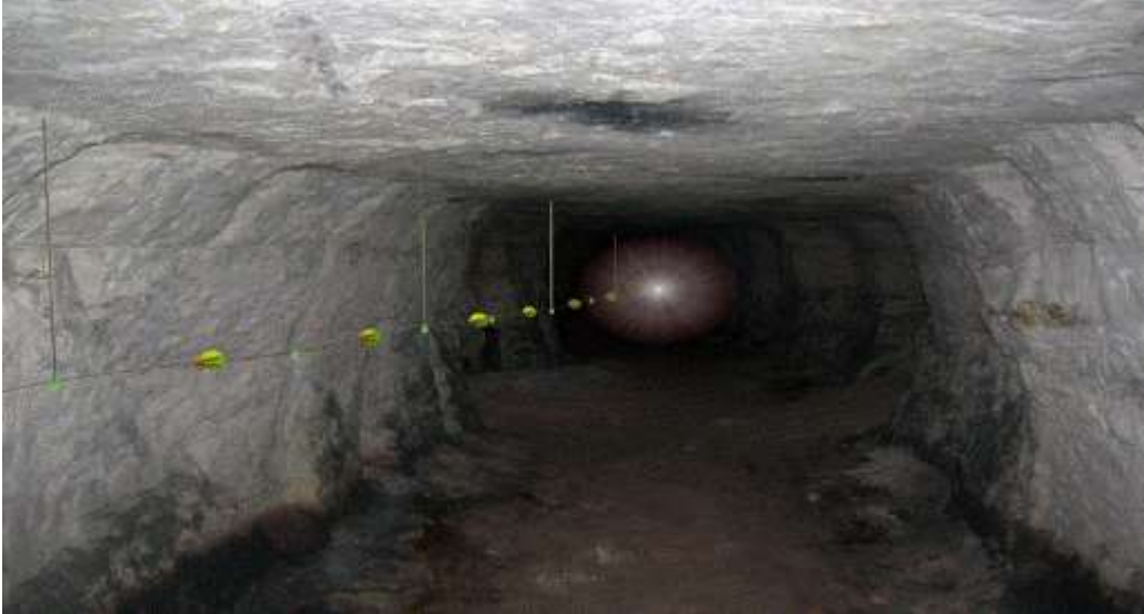
Şekil-1: Hayat hattı görünümü

18. (Ek:RG-10/3/2015-29291) (3) Yeraltı madenlerinde, hazırlık faaliyetlerinin yapıldığı alanlar ve üretim panoları gibi yeraltı maden işletmesinin bütün bölümlerini kapsayacak şekilde ve çalışanların yerüstüne çıkmalarını kolaylaştıran; yanmaya, kopmaya ve aşınmaya karşı dayanıklı bir hayat hattı kurulur (Şekil-1 ve Şekil-2). Bu hatlar acil durum planlarına uygun olarak yerleştirilir.