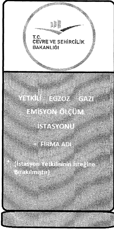
Tabela ölçüleri istasyondaki alanın fiziksel imkanlarına bağlı olarak istasyon yetkilisinin isteğine bırakılmıştır.